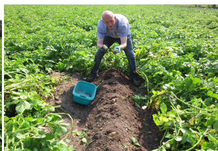
Probenahme am Schlag "Moor"